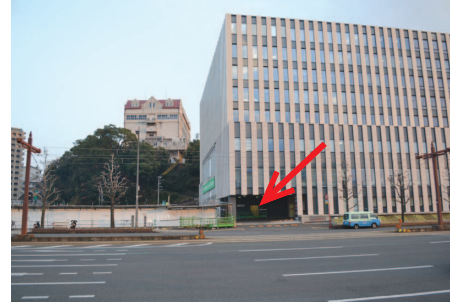
【↑国道側入口（路面電車の通り側）】